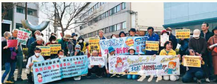
「北陸新幹線延伸を考える西京連絡会」のアピールウォーク(3月1日)

西京区を縦断する「桂川ルート」上には、桂川小学校～西京都病院～桂川街道～桂離宮などが位置し、「地下水が枯れたり、地盤沈下が心配」「30年後の新幹線よりバスを便利にして」などの声が上がっています。延伸中止へ、ご一緒に力をあわせましょう。