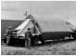
経ヶ岬へ設置予定のXバンドレーダー

ミサイル防衛にたいする幻想を国民にいだかせ、さまざまな形で米軍基地を認めさせることは、国民をあざむくものにほかなりません。