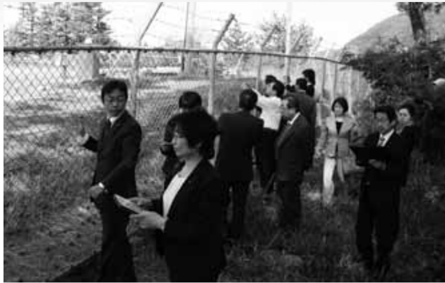
Xバンドレーダー設置予定地を視察する府会議員団