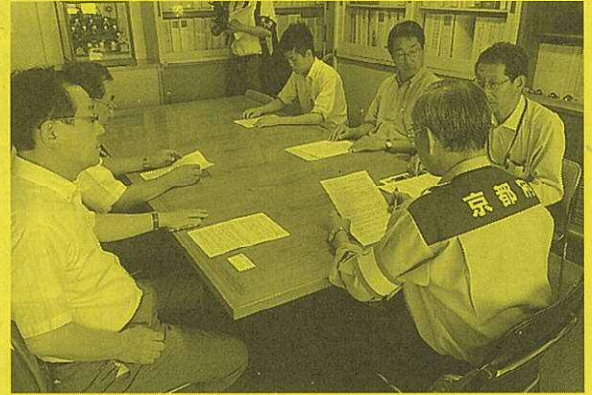
申し入れをする府会議員団

京都府が発表した補正予算と制度の主なものを紹介します。制度活用で必要となる罹災証明は、市町村役場で発行されます。(2014年9月1日現在)