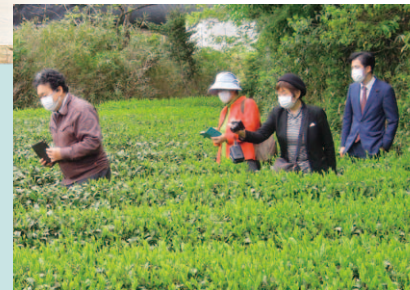
霜被害と価格下落の茶農家を訪問・調査