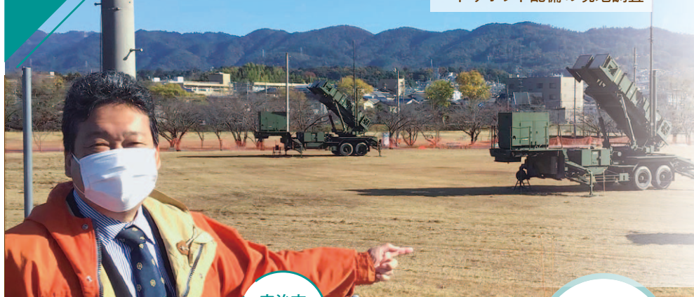
宇治駐屯地でのペトリオット配備の現地調査