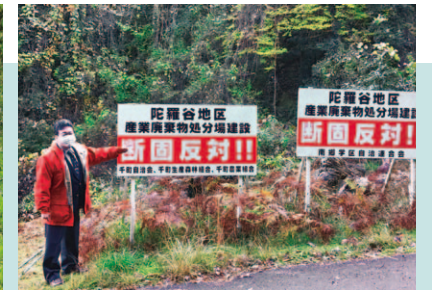
宇治市、京都市、大津市の境界地域での環境壊す産業廃棄物処分場建設反対