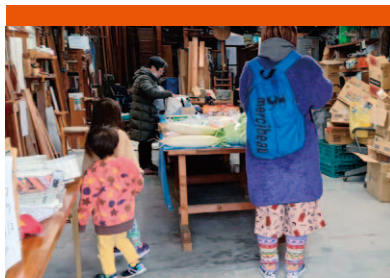
下京食糧支援プロジェクトの取り組みに相談員として参加しました。(12月12日)