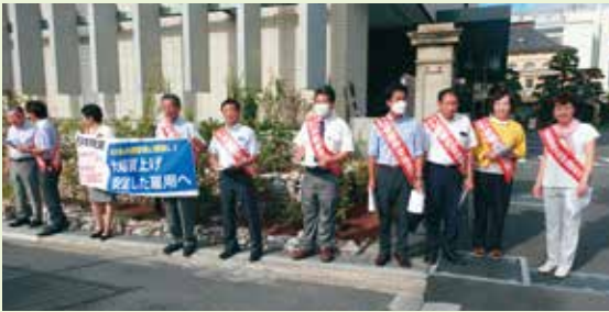
代表質問当日、府庁前で早朝宣伝(9月19日)

また、教員の授業の持ち時間の多さについて、中教審の提言を受けての対応をただしたところ、理事者は「標準授業時数を上回っている学校には是正の指導を行った。その後の改善結果については調査中で、その結果を踏まえて対応する」と答弁しました。