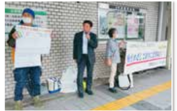
消費税をなくす京都の会の署名・宣伝行動

北大路タウン前での「消費税をなくす京都の会」の宣伝・署名行動で、私もマイクを握り、大企業の内部留保金の総額539兆円と消費税の税収総額539兆円が同額だということを示し、消費税5%への減税と大企業の内部留保金に課税して中小企業支援と賃上げにまわせ、と訴えました。