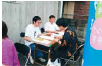
北区食料提供プロジェクト

北区食料提供プロジェクトには、学生47人を含む計69人が食料を受け取りに来られました。私も玉本市議も青年・学生のみなさんへのアンケート・対話に参加しました。対話では、「米や野菜が高くて買えない」など高額費と物価高に苦しむ青年・学生の深刻な実態が出されました。