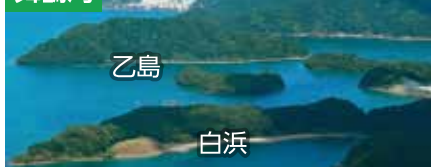
乙島、白浜に弾薬庫の増設が計画されている