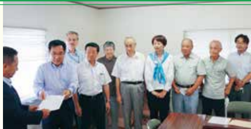
丹後広域振興局へ申し入れ(8月8日)

党京丹後市議団からの連絡をうけ、8月に害虫や鳥獣による農作物被害に対する支援を緊急に申し入れたところ、9月府議会の答弁で、特に被害の大きい果樹カメムシ類による食害への支援の表明がありました。5月まで遡及適用されます。引き続き、米も対象にするとともに獣害対策の強化も求めています。