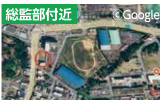
地下化される總監部の付近に保育所移転を計画